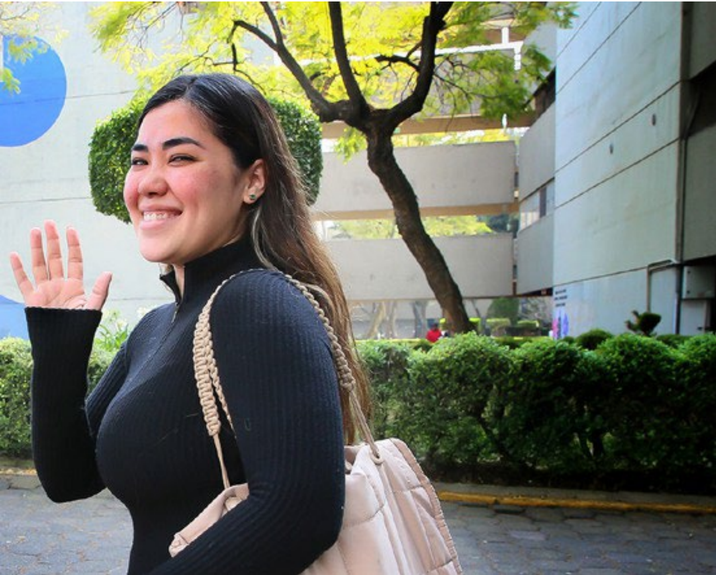
Unidad Xochimilco / DCS UAMFoto / Alejandro Juárez Gallardo.