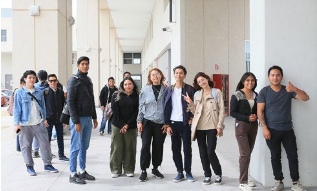
Unidad Lerma / DCS UAMFoto / Alejandro Juárez Gallardo.